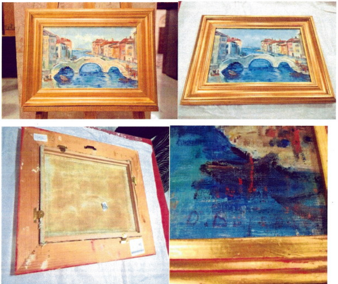
Tablou "Venetia" - Sorin Ionescu